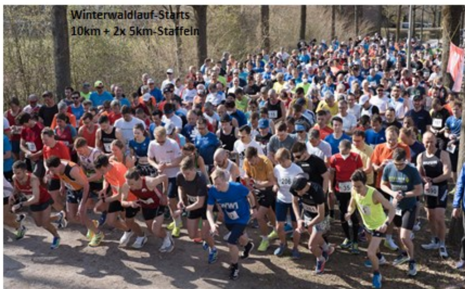
Winterwaldlauf-Starts 10km + 2x 5km-Staffeln