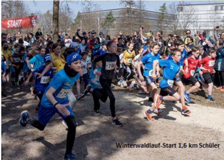
Winterwaldlauf-Start 1,6 km Schüler

Sportgemeinschaft Siemens Erlangen Leichtathletik e.V.